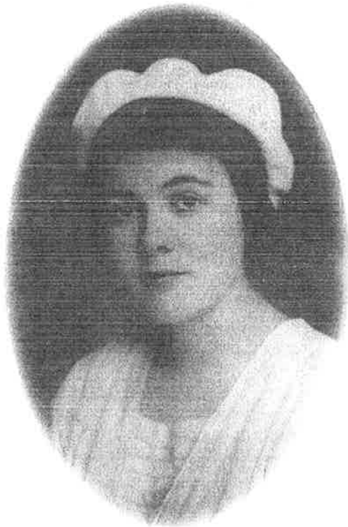
Karin Boye som ung student.